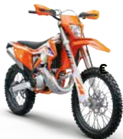
KTM 250 EXC 2023 10.590 +TK

MEILTÄ PYÖRÄT - VARUSTEET - HUOLTO - VARAOSAT TSEKKA VAIHDOKKIMME WWW.MOTOPALVELU.COM