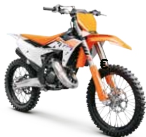
KTM 125 SX 2023 9.580 +TK