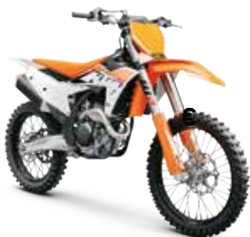
KTM 250 SX-F 2023 10.790 +TK